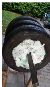
Der Floater an Land

Über Funktechnologie kommunizieren unsere Standorte autonom. Im Zeitalter der Informationsgesellschaft ist Unabhängigkeit für künstlerische Positionierungen unerlässlich. Der Floater, ein Projekt des Infolabs, wurde von 16.-19. Mai 2018 im Rahmen des Festivals AMRO gezeigt.