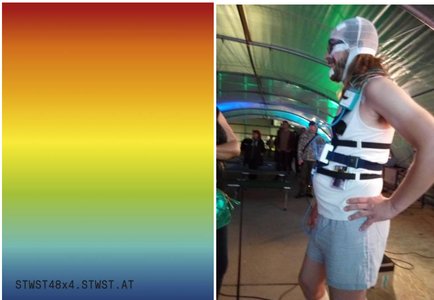
48 Hours Art as Sleep