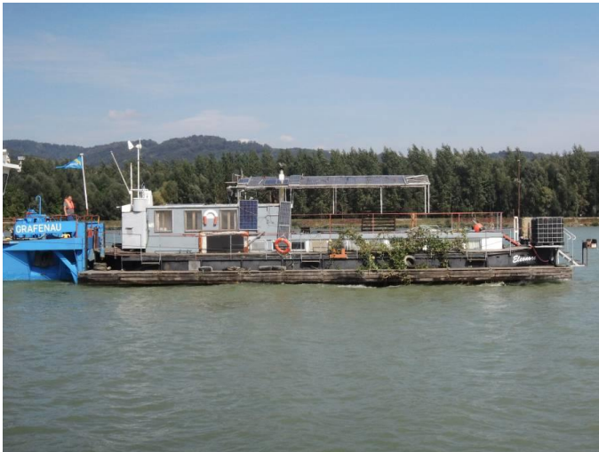
Vom Winterhafen in die Traun

In den letzten 5-10 Jahren war das Artist-in-Residence-Programm auf dem "Messschiff Eleonore" eine Haupt-Schnittstelle zur internationalen Kunstwelt. Da 2018 das Schiff Eleonore weiter an die Peripherie von Linz verschoben und das Schiff neu adaptiert werden musste, wurde auf der Eleonore 2018 "nur" ein internes Mess- und Arbeitslabor neu installiert. Die Aufenthalts- und Versorgungsmöglichkeiten mussten 2018 seitens der STWST neu angedacht und grundsätzlich einjustiert werden.