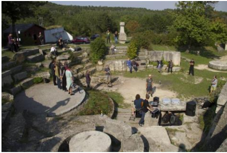
RiP in Lindabrunn