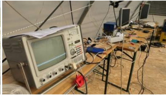
RiP in Linz

Das Projekt wurde unterjährig entwickelt und in Linz während STWST48x4 im September gezeigt. Im Sommer 2018 fand eine Kooperation des STWST-Infolabs mit dem Symposium Lindabrunn in NÖ statt. Die beiden Orte Linz und Lindabrunn wurden im Projekt "RiP / RANDOMNESS IN PAST" als Meta-Tunneling-Projekt verbunden.