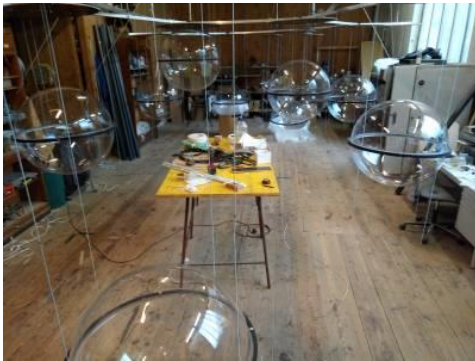
Archiv und Werkstattbereich im Kunstlager Nord

Das alte "Kunstlager" der STWST wurde 2017 an einen neuen, größeren Ort übersiedelt. Es entstand das "Kunstlager Nord" in der Leonfeldnerstr. 289. Im "Kunstlager Nord" sind sämtliche Unterlagen der Administration, Projektunterlagen, Bildsammlungen, Dokumentationen, Publikationen, Unterlagen zu Veranstaltungen, zum Print Versorgerin - und vor allem Relikte, Materialien und Objekte aus 40 Jahre Kunstschaffen der STWST gelagert. Das Kunstlager Nord wurde in seinen räumlichen Gegebenheiten, seiner grundlegenden Struktur und Ordnung über das gesamte Jahr 2018 bearbeitet. Außerdem konnte im als Werkstatt adaptierten Teil dieser Räumlichkeiten der STWST-Beitrag für die Biennale Taipeh hergestellt werden.