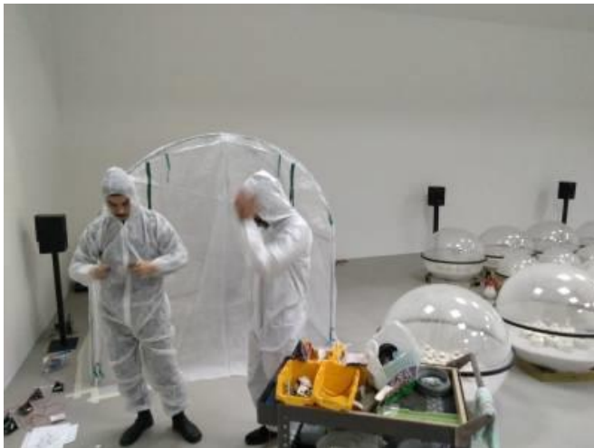
Das Infolab und die Frage nach Information bei Pilzen und Mycelien

Bereits oben bei den Jahresschwerpunkten angeführt, ist der Biennale Taipeh-Beitrag der "Mycelium Network Society" und das Objekt "Patulin" ein Infolab-assoziiertes Projekt. Wie alle Infolab-Projekte hinterfragt auch dieses Projekt grundlegend das Wesen von Information, bzw versucht, als Alternative zum IT-Informationsbegriff auf andere Weise mit Natur und Technologie zu experimentieren. Die Planung und Herstellung dieses Projektes beanspruchte 2018 größere Materialressourcen und Arbeitsleistungen. Zu MNS, Patulin und zum Biennale-Beitrag: s. auch 1.1.1.