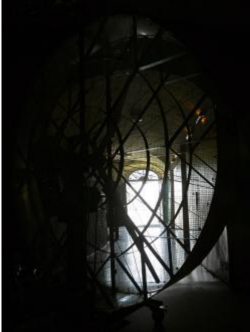
Die Windmaschine in der STWST

Quasikunst ist Research- und Kunstpraxisformat der STWST mit jeweils eigenen Projekten, die unterjährig erarbeitet werden und im September während STWST48 gezeigt werden. Außerdem war Quasikunst auch 2018 einer der übergeordneten Strukturbegriffe innerhalb STWST48.