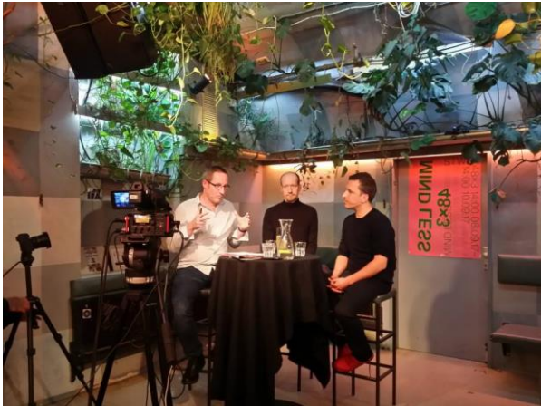
Debatten zu Kultur & Politik

Die im Cafe Strom stattfindende Reihe wurde mit unten genannten Themen veranstaltet von Radio FRO und Dorf TV übertragen. Als öffentliche Diskussionsveranstaltungen wurden auch 2018 Themen der Stadtwerkstatt in erweiterte politische, kulturelle und vor allem künstlerische Kontexte gestellt. https://newcontext.stwst.at/discursive-media/strom_um_sieben