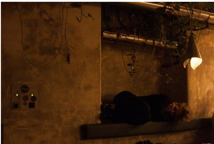
Das offene Projektende "Social Sleep"

Besonders aus einer sich Ende 2016 verschärfenden Problemlage im Cafe Strom und den Öffentlichkeitsbereichen des Hauses griff die STWST das von LINZimPULS ausgeschriebenen Thema „Öffentlichkeit und Verdrängung“ als Projektthema auf. Es wurde mit unterschiedlichen Projektmitwirkenden mit jeweils wissenschaftlicher, performativer und sozialer Expertise kommuniziert, so dass mit Beginn 2018 das Projekt in seiner Recherchepraxis in den Öffentlichkeitsbereichen des Hauses gestartet werden konnte.