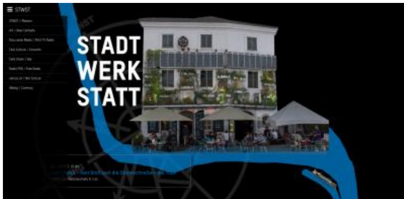
Die Stadtwerkstatt / Startseite Homepage

Die Stadtwerkstatt setzte 2018 die unten angeführten Projekte laut Schwerpunkten des eingereichten Jahresprogramms 2018 um. Die angepeilten Ziele waren: ein forcierter Ongoing-Research innerhalb der eingeschlagenen Schiene der neuen Kunstkontexte, der Blick auf Außenwirkung, Überregionalität und Internationalität, sowie die längerfristig orientierte Auseinandersetzung mit dem Thema „Archiv“ und Überlegungen zum 2019 anstehenden 40jährigen Jubiläum der Stadtwerkstatt.