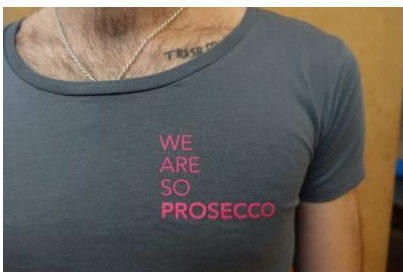
Die Prosecco City of Media Arts

Die STWST kampagnisierte 2018 eine "Prosecco City of Media Arts", die einerseits auf die Bedeutung der frühen Stadtwerkstatt für die Medienkunst hinweist, gleichzeitig über die aktuelle Kunstproduktion auf Kritik am herkömmlichen Medienkunstbegriff verweist: