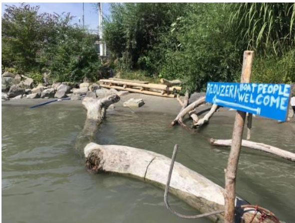
Der Blick von der Wasserseite

Auf dem DeckDock, der STWST-Lände an der Donau, gestalteten KünstlerInnen nun schon das fünfte Jahr Gesamtkunstwerke mit soziokulturellem Anspruch. 2018 war das das Projekt "Reouzeri", innerhalb dessen ua mit dem natürlichen Material "Das Schwemmholz der Donau" gearbeitet wurde: https://newcontext.stwst.at/deckdock/reuserie