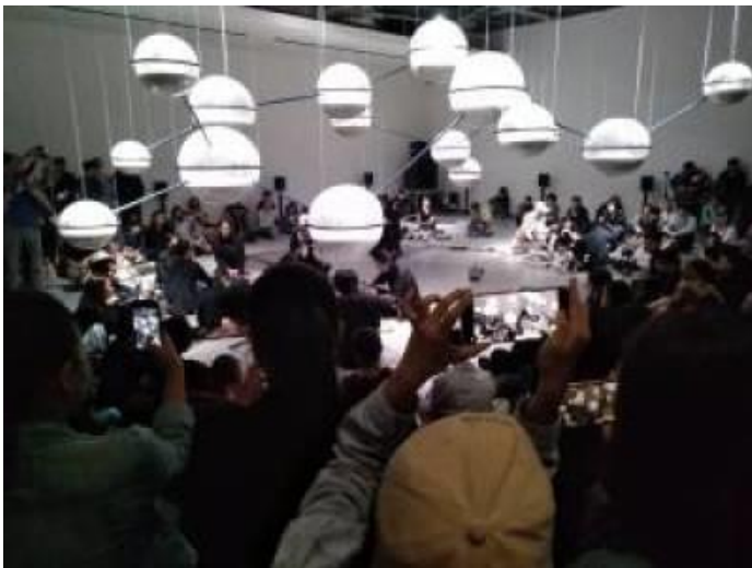
Die Eröffnung der Mycelium Network Society in Taipeh

Mycelium Network Society / Biennale Taipeh: Die Mycelium Network Society wurde auf der 11. Biennale Taipeh, Ausgabe „Post-Nature-A Museum as an Ecosystem“, vom 17. November 2018 bis 10. März 2019 präsentiert. Die MNS zeigt eine Patulin-Struktur mit 17 Atomen, in der Lingzhi-Myzele kultiviert und maßgeschneiderte Elektronik und Leiterplatten mit FM-Radio installiert werden, um die verschiedenen physikalischen Eigenschaften wie Feuchtigkeit und Temperatur aus dem Pilzwachstum zu übertragen.