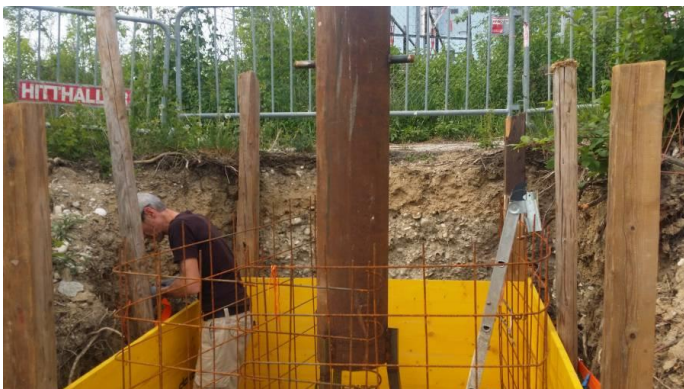
Potentiell Anlegemöglichkeit auch für eine Schute

Die Schute an der Donaulände vor der Stadtwerkstatt ist ein langfristiges Vorhaben der Stadtwerkstatt. Umsetzungsmöglichkeiten wurden in mitlaufender Art und Weise auch 2018 diskutiert. Die Anlegemöglichkeit, die für das Messschiff Eleonore in der Traun geschaffen wurde, könnte auch für eine Schute, Leichter oder Barge verwendet werden.