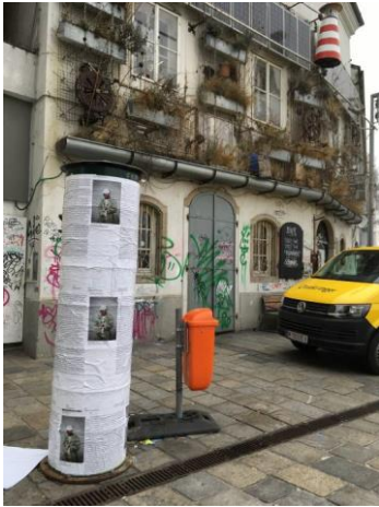
Fehlende Plakatflächen in der Stadt

Am Bild befindet sich der Prototyp einer Litfaßsäule, die 2018 der STWST hergestellt wurde. Eine weitere Litfaßsäule findet sich bereits in einer befreundeten Linzer Institution.