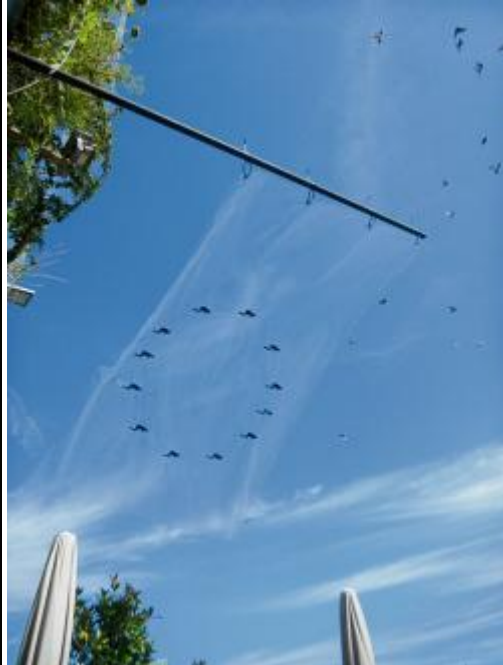
Halbtransparente Flagge des Driftings

Windlines und vier verblasenen Koordinaten: Dem künstlerisch-theoretischen Aufbau von Quasikunst folgte den vorangegangenen, beinahe immateriellen "Materialien" Nebel und Eis 2018 der Wind, bzw eine systemisch-performative Auseinandersetzung mit der Thematik Wind und Luft.